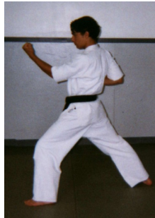
Shomen Tzuki Double (Coup de poing de démonstration double)